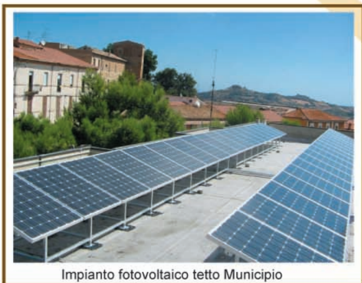
Impianto fotovoltaico tetto Municipio

solari e recupero acque grigie sopra la sede del Centro Sociale Anziani, prossima sede della Enoteca Comunale.