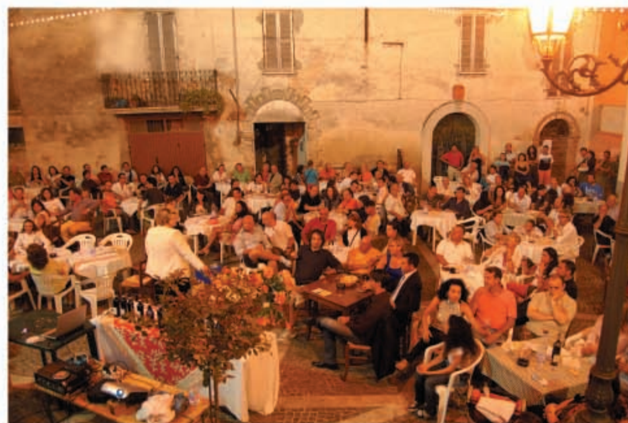
Festa del Vino - ultima edizione